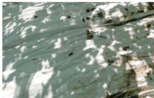
新梢管理を小まめに行う

シャインマスカットに満開30日後（トンネル作型7月上旬）に反射マルチを被覆することで、糖度の上昇が期待できる。