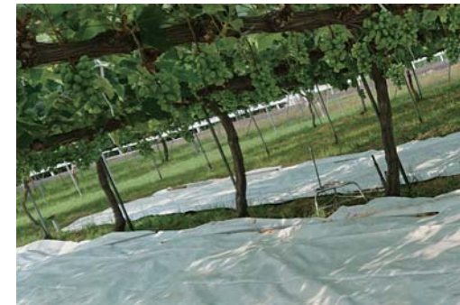
適正な着果数に制限