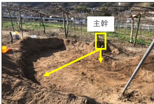
主幹からの距離、深さ別に根を採取