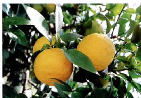
写真1 屋根かけハウスユズ

編集発行 愛媛県立果樹試験場 〒791-0112 松山市下伊台町1618 TEL 089-977-2100 FAX 089-977-2100