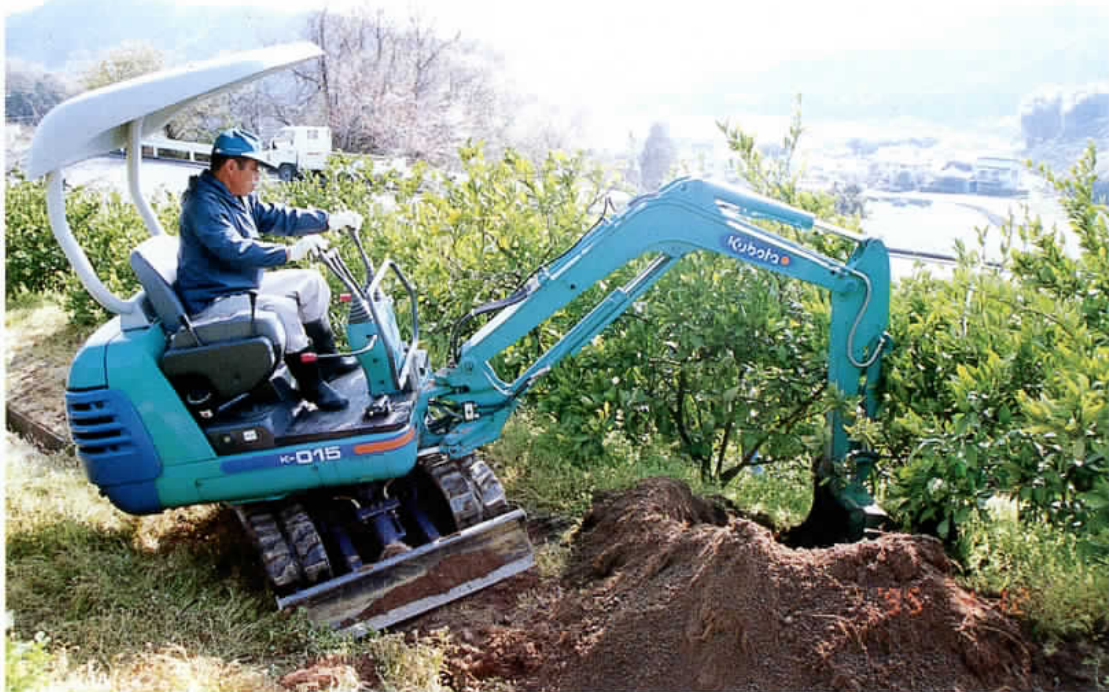
小型油圧式ショベルを利用したミカン苗木の移植

温州みかんは平成6・7年の干ばつ等の影響もあって、全県的に多くの園地で8年産が不作、9年産が豊作となり、強い隔年結果が進行している。これを改善して安定生産を図るには、裏年であれば、せん定を遅くして、程度も軽くするといったことだけでなく、施肥や土壌管理等、裏年なりの総合的な管理を行う必要があることはいうまでもない。早いうちに隔年結果をなおしたいものである。