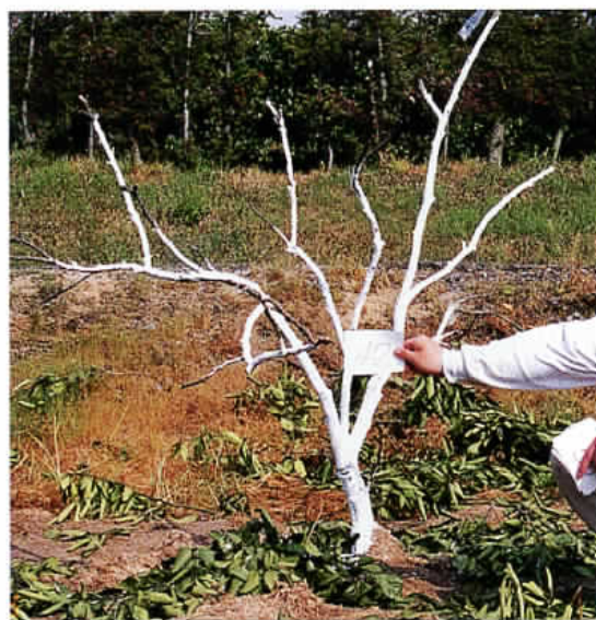
移植樹の枝のせん除