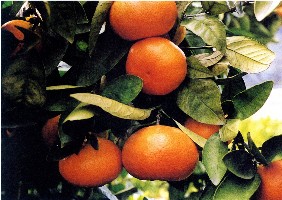
写真1 ‘ひめのか’の結実状態