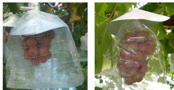
写真左 網袋の設置の様子

また、7月下旬から収穫期まで、各試験区の果房中心部に自記温湿度計を設置して、果実袋内の温度を測定した。