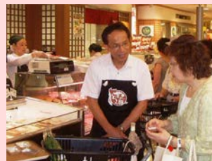
生産者による京阪神等での販売促進