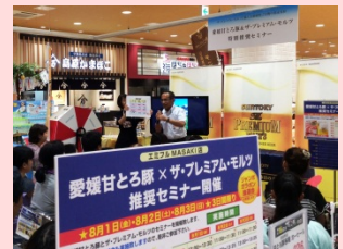
企業と連携したブランド力向上活動