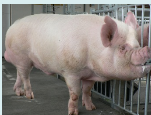
中ヨークシャー種（雄）