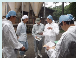
生産農場での技術検討会