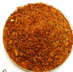
乾燥・粉砕した柿果皮