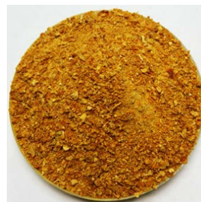
乾燥・粉砕した陳皮