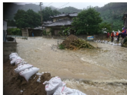
①明浜町 俵津 (土のう積み)