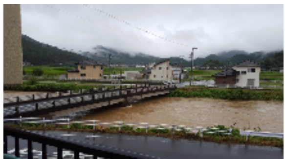
①宇和町 (宇和川増水)