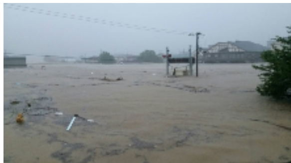
①野村町 (ダム下流はん濫)