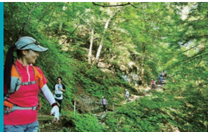
遊歩道は適度なアップダウンで初心者でも安心

雄大な草原が広がる四国カルストの直下に、巨木が茂る原生林が広がっていることを知っていますか？ 姫鶴平から車道を下ること約3kmの国有林地内に整備された猪伏大トチ遊歩道は、木漏れ日を浴びながら、森林浴気分が楽しめるお勧めのコース。折り返し地点にある樹齢600年、高さ約30メートルの大トチは必見です！