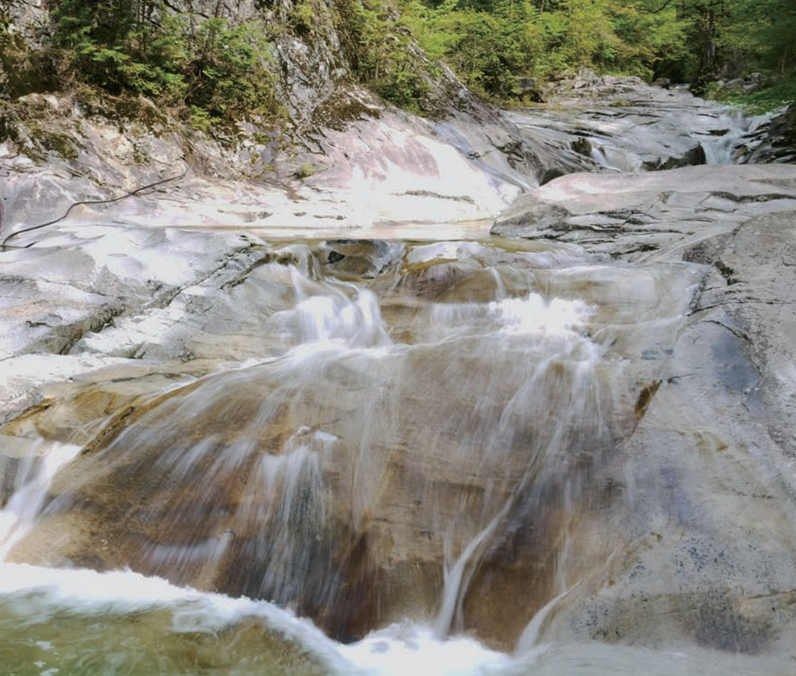
岩肌を滑り落ちるように流れていく鉄砲石川