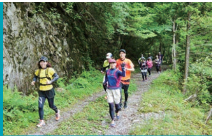
林道は広々としていて、大勢でも安心して走れる

面河溪の支流・鉄砲石川は、ダイナミックな本流の渓谷とは打って違って、穏やかで女性的な雰囲気が漂う癒やしスポット。川沿いに幅の広い林道が約3kmに渡って整備されており、安心して散策が楽しめます。林道終点から渓谷に降りると、一枚岩の川床が広がっており、沢登りなどもでき、体いっぱい大自然を満喫できます。