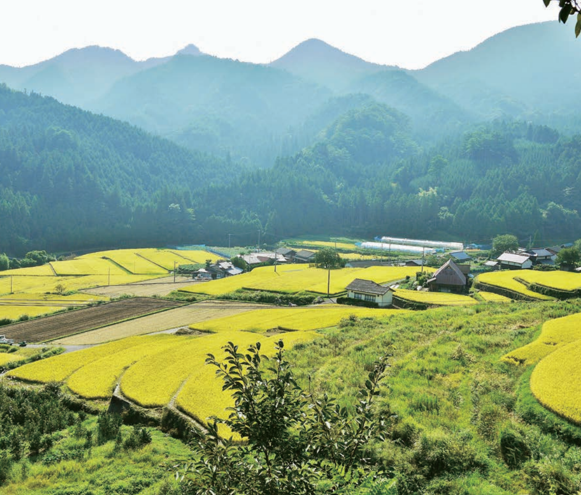
上畑野川地区に広がる美しい棚田の風景