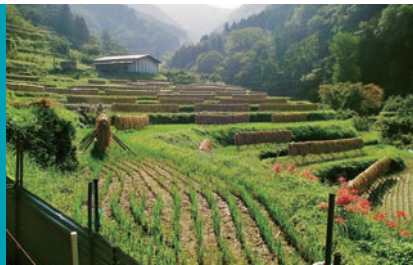
遍路道脇に幾重にも続く美しい棚田

松山市と久万高原町の境にそびえる三坂峠は、古来、四国遍路の最難所として知られる険しい峠道。急峻な斜面に広がる杉木立の中には、往時の姿を残す古道が続きます。落ち葉を踏みしめ、石畳を歩き、登りきった先にある三坂峠からの道後平野の眺めは格別! 歴史を感じながら達成感も味わえる、上級者向けコースです。