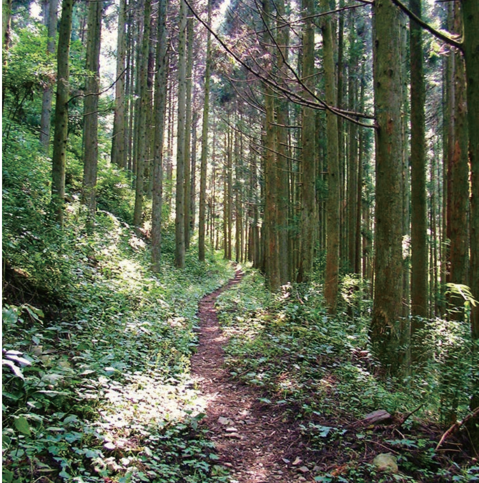
杉木立の中に続く遍路道