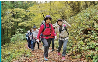
老若男女、気軽楽しめるハイキングスポットとして人気