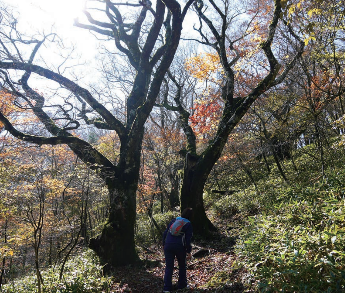
登山道沿いに茂るブナの巨木