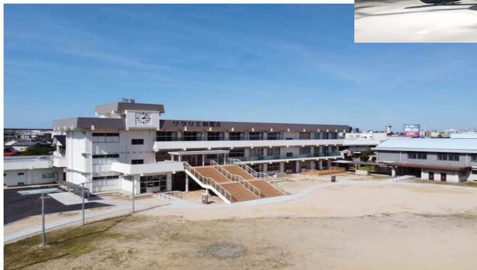
候補地①：ワクリエ新居浜