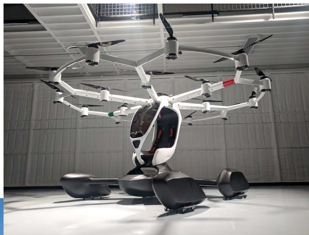
アメリカのリフト・エアクラフト社の 「空飛ぶクルマ」実機