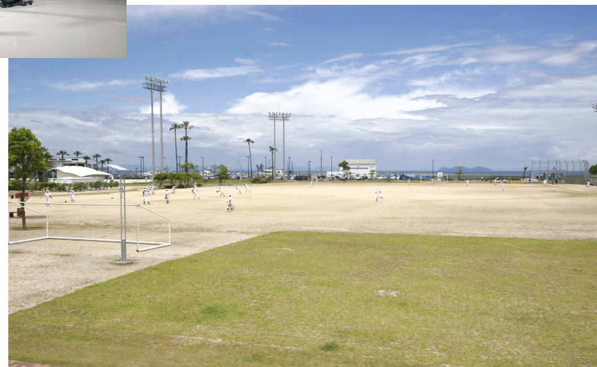
候補地②：マリパーク新居浜