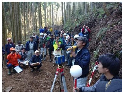
（研修「地上レーザ計測」）