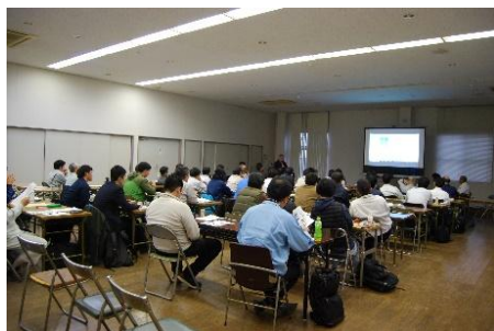
（研修「森林経営管理制度」）