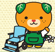
愛媛県イメージアップキャラクター みきゃん