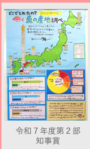
令和7年度第2部 知事賞