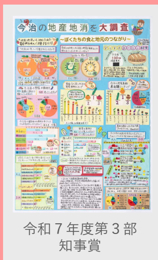
令和7年度第3部 知事賞