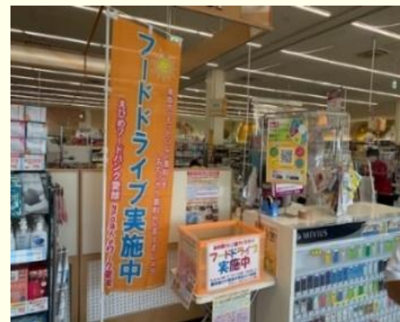
常設型フードドライブコーナー設置店舗

( https://www.pref.ehime.jp/page/9812.html )