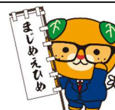
まじめきょん (まじめ課長)