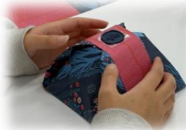
ラッピングの完成品