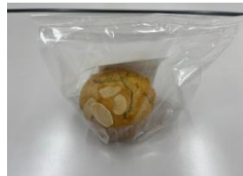
はだか麦マフィン