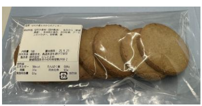
はだか麦とおからのクッキー