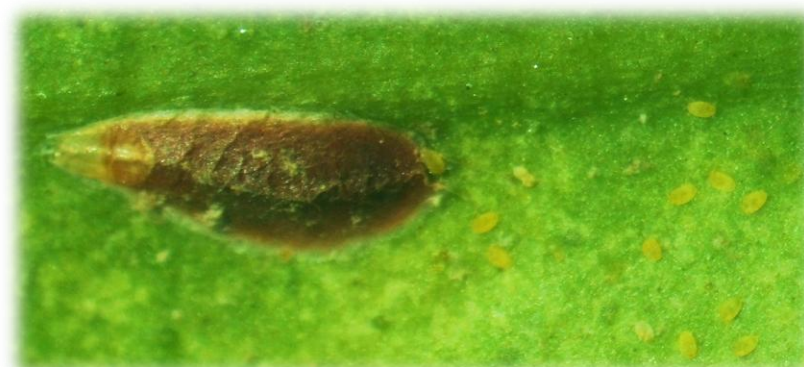
雌成虫と孵化幼虫(体色黄色)

ヤノネカイガラムシの薬剤防除適期は、 第1世代は、第1世代幼虫初発日の30~35日後(アブロード剤、モベントフロアブルは20~25日後) です。 第2世代は、第2世代幼虫初発日の30日後頃 です。