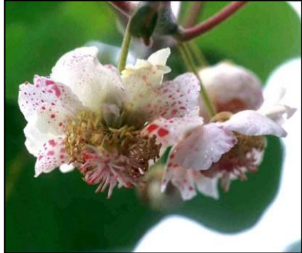
写真1 液体受粉後の雌花