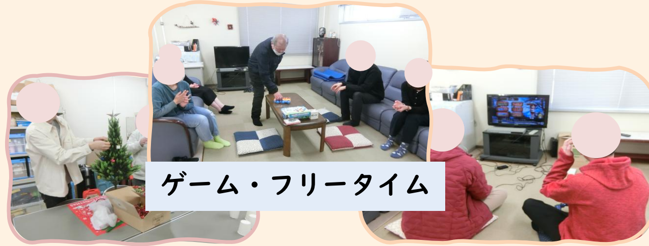
ゲーム・フリースタム