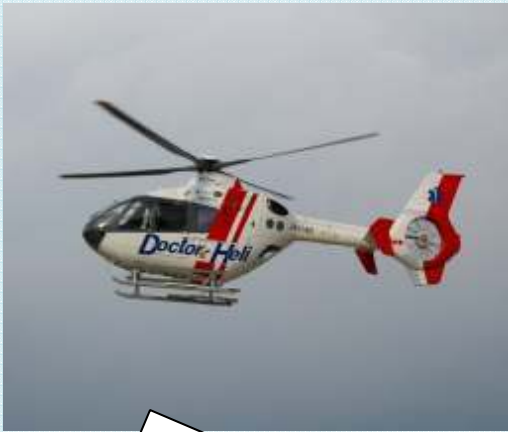
導入するドクターヘリ 「EC135型」