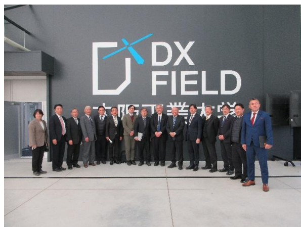
大阪工業大学枚方キャンパス （大阪府枚方市）