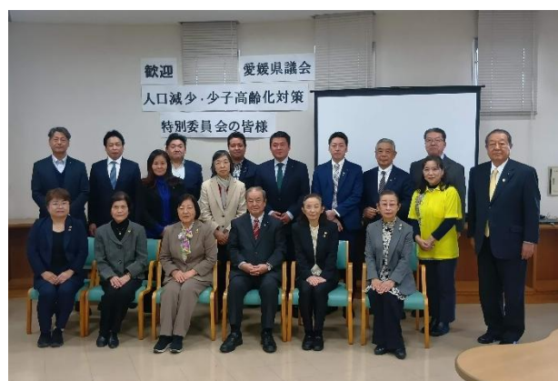
一般社団法人沖縄県女性の翼 (沖縄県那覇市)