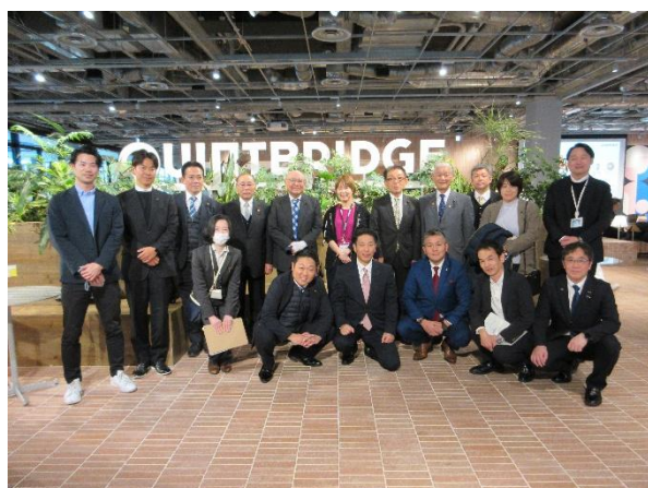
QUINTBRIDGE（クイントブリッジ） （大阪府大阪市）