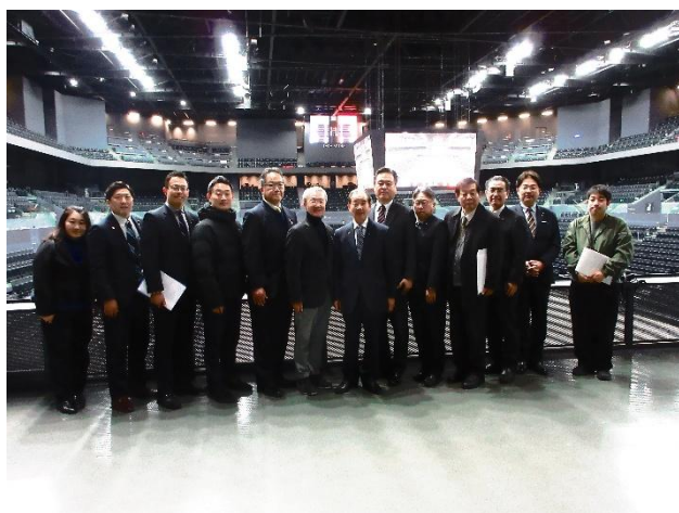
SAGA アリーナ （SAGA サンライズパーク内） （佐賀県佐賀市）