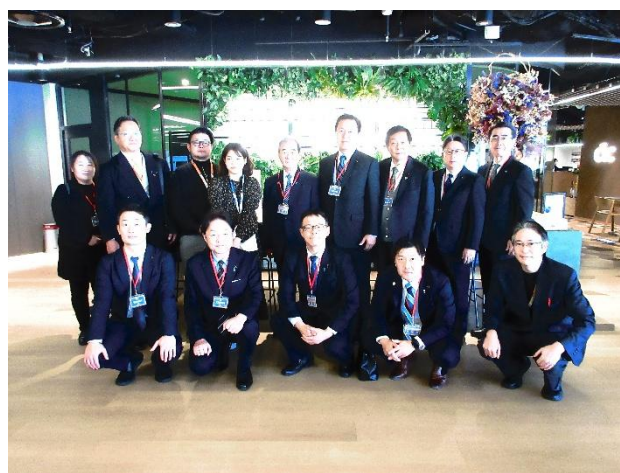
CIC Fukuoka グローバルコネクト福岡 （福岡県福岡市）