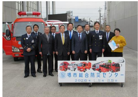
堺市総合防災センター (大阪府堺市)