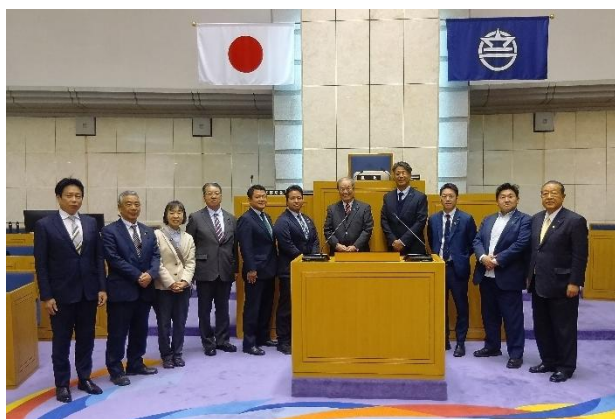
浦添市議会 (沖縄県浦添市)