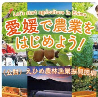
えひめ農林漁業振興機構