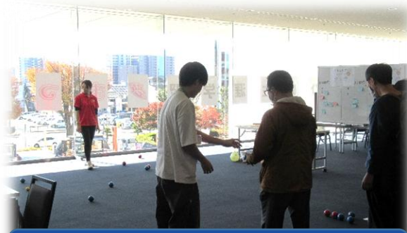
レクリエーション体験