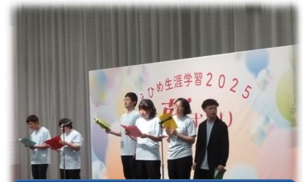
朗読ミュージカル