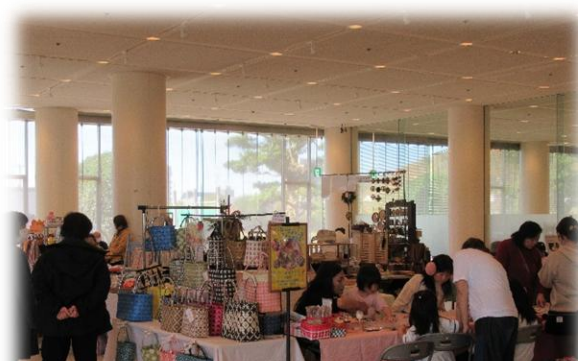
ハンドメイドマーケット