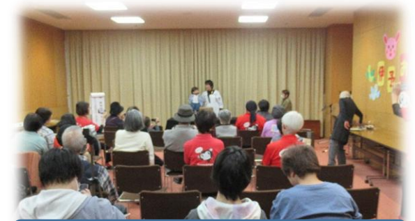
伊予おはなしひろば