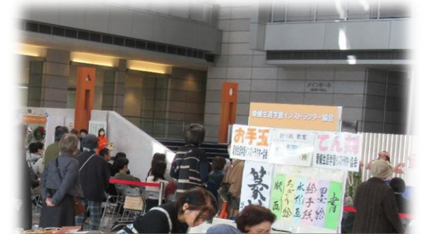
てん刻・お手玉・折り紙