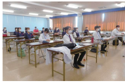
多職種合同の新規入職者研修