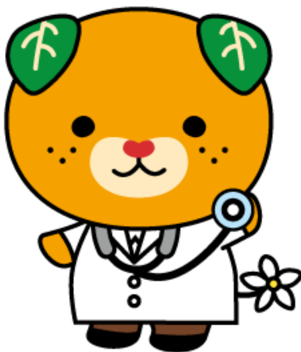
愛媛県イメージアップキャラクター みきやん