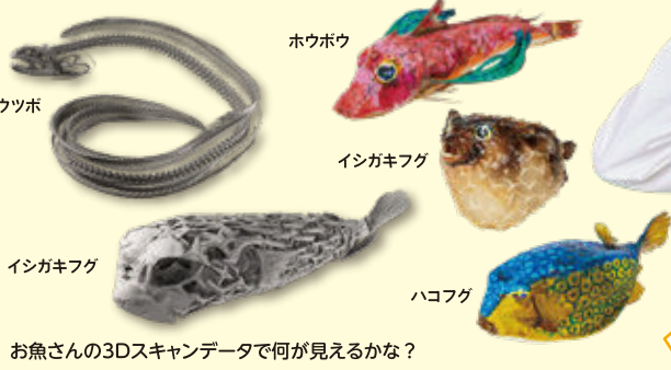
お魚さんの3Dスキャンデータで何が見えるかな？