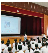
今治西中学校での講演の様子

令和 4 年度：5 校、令和 5 年度：2 校、 令和 6 年度：1 校 (令和 6 年 12 月 2 日現在)