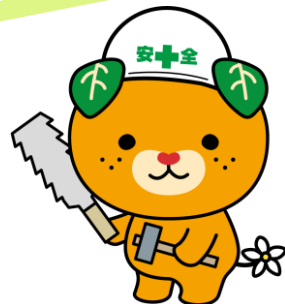
愛媛県イメージアップ キャラクター みきやん

体育館ではバドミントンや卓球等をしています。ラダーゲッター・パタンクや手作りモルック・クップでレクリエーションを楽しみました。