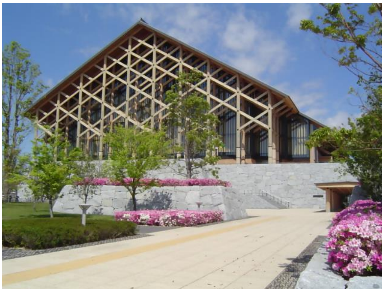
Velo-city 2027 の会場となる愛媛県武道館

自転車は全国的に交通手段の約 13% を占めています。また日本には数多くの自転車メーカーや自転車部品サプライヤーがあります。世界的に見ても、日本は効率の高い公共交通機関システムで有名です。