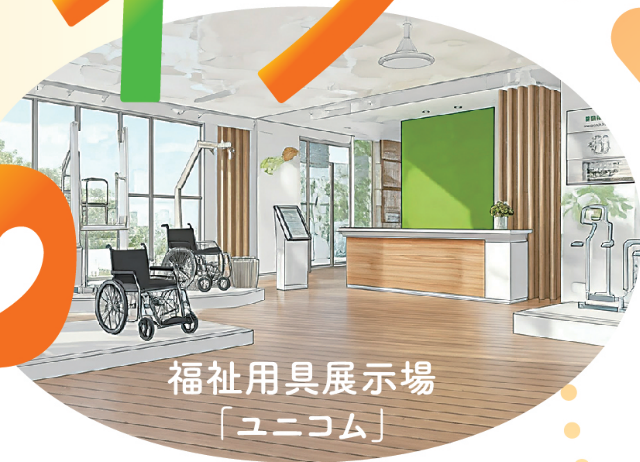
福祉用具展示場 「ユニコム」