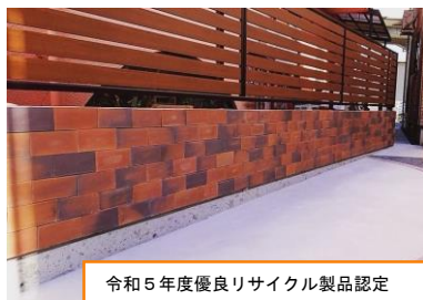
令和5年度優良リサイクル製品認定