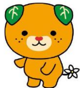
愛媛県イメージアップキャラクター

愛媛県東予地方局 今治土木事務所 管理課 県営住宅窓口（庁舎4階） 〒794-8502 今治市旭町1丁目4-9 TEL (0898) 23-2500（内線265）