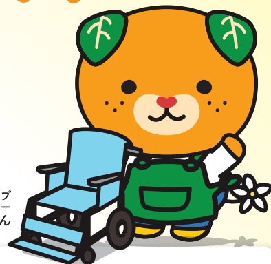
愛媛県イメージアップ キャラクター みきゃん