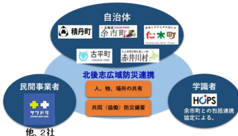
図1：北後志広域防災連携のイメージ図