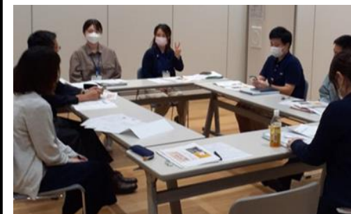
UI/UXを検討・検証する会議体「LINEデザイン会議」