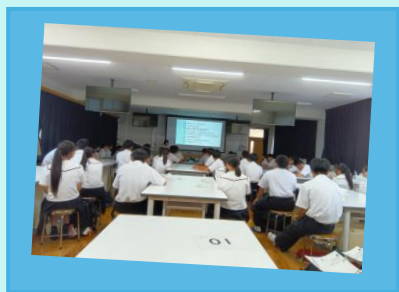
『高校での献血講座』