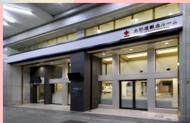
大街道献血 ルーム

地域で見かける献血バスや松山市の大街道献血ルームでボランティアができることを知っていますか？ 献血 は患者の尊い生命を救うことができる、なくてはならない大切なボランティアです！