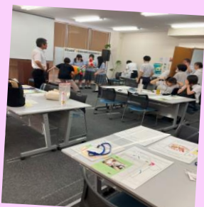
『愛顔の高校生 献血推進会議』