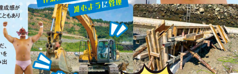
マタイガー マスク