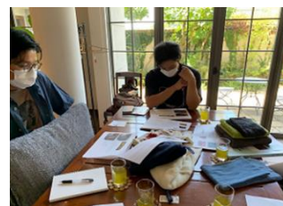
個別商品開発会議