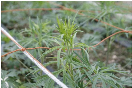
写真1 さくらひめの一番花抽台後の出蕾