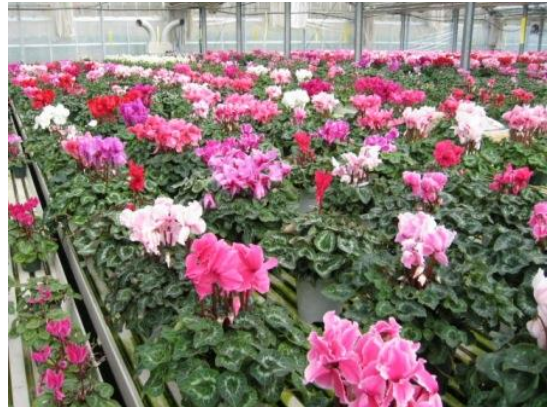
写真2 出荷期を迎えたシクラメン