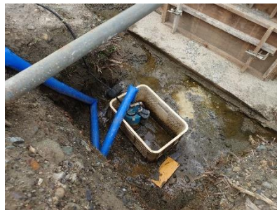
・ 水中ポンプ 3