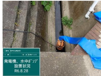
・ 水中ポンプ 2