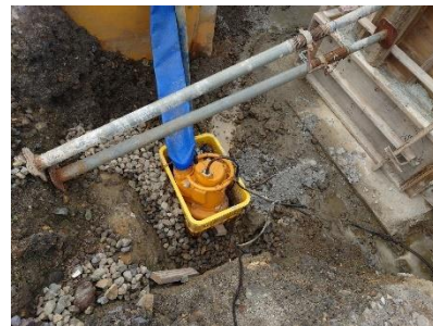
・ 水中ポンプ 4