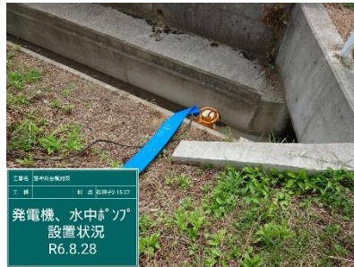
・ 水中ポンプ 1