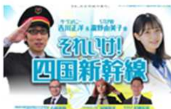
オンラインライブイベント(R3)