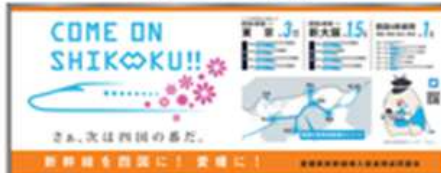
松山駅への看板等の設置(H30~)