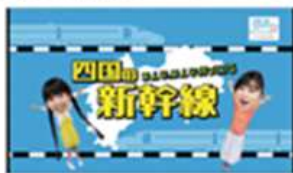
動画やTV番組放映(R元~)