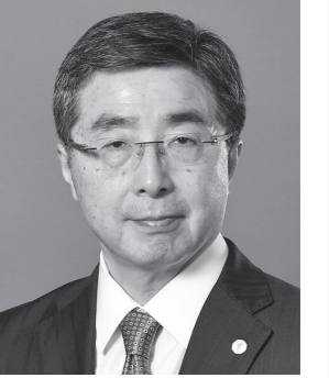
最高裁判所判事 いし かね きみ ひろ 石兼公博 昭和三十三年一月四日生