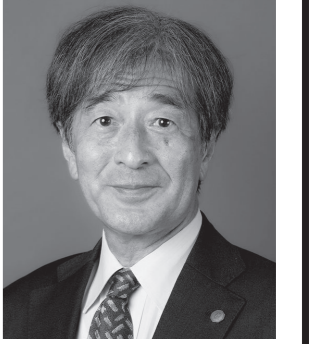
最高裁判所判事 尾島 明 昭和三十三年九月一日生