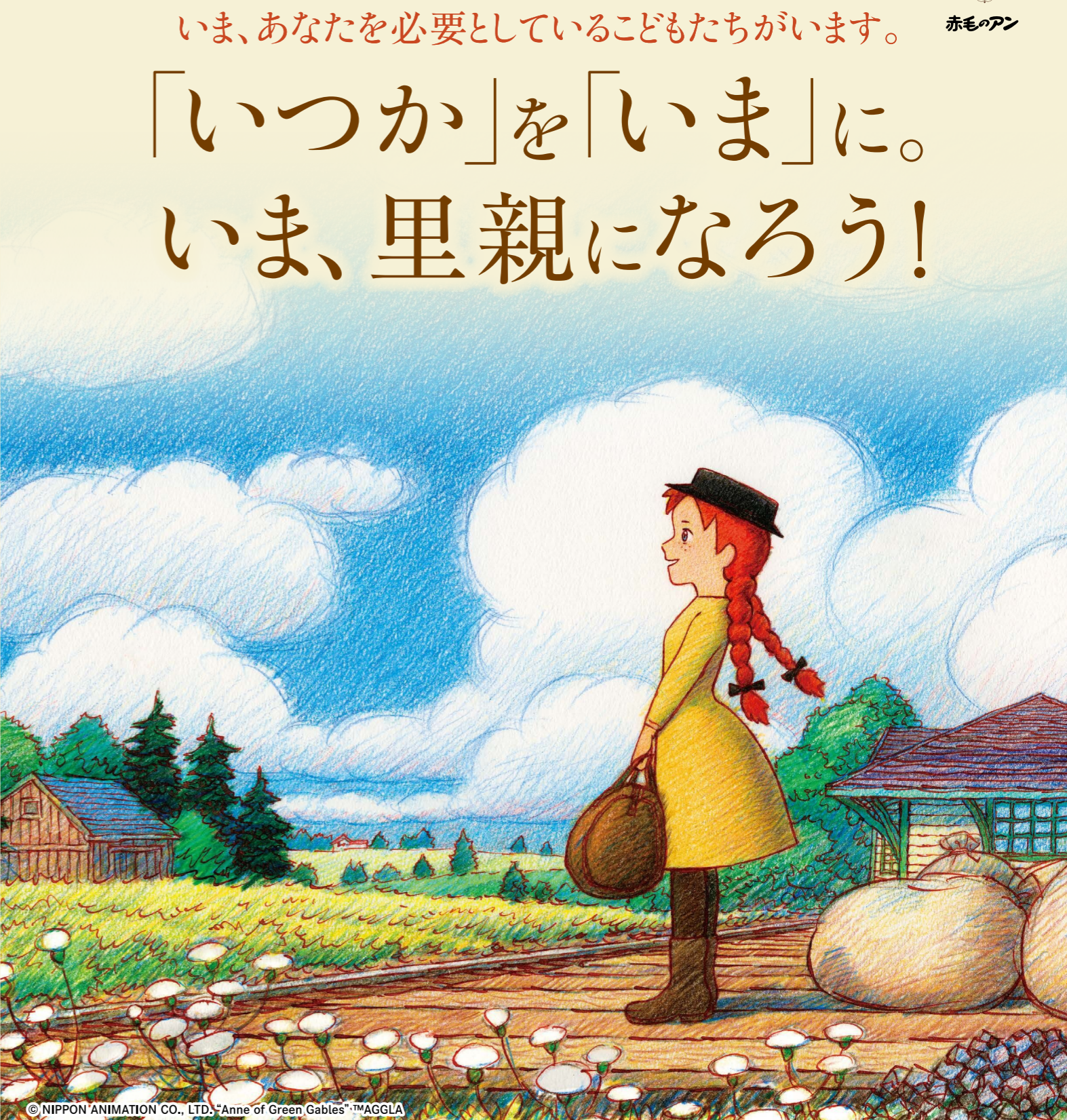
© NIPPON ANIMATION CO., LTD. "Anne of Green Gables"™AGGLA

あたたかな家庭を心から願ったアンは、マッシュとマリラに出会い、二人の愛情に包まれながら、自分らしく豊かで幸せな人生を歩みます。 いま、日本には親と離れて暮らす子どもたちが、約4万2千人います。「里親制度」は、そうした子どもを自分の家庭に迎え入れ、必要な生活費や養育に関する相談など、さまざまなサポートを受けながら育てる制度です。 子どもの成長には、とによりで応援してくれる大人が必要です。子どもたちの力になれるのは、あなたです。