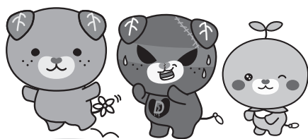
愛媛県イメージアップキャラクター