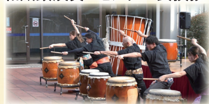
伊豫之二名島扶桑太鼓

先着100名様のうち抽選で20名様に 砥部焼（ヨシュアブルー）フリーカップ 1つプレゼント！