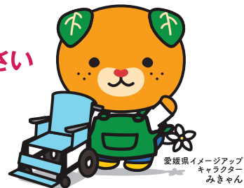
愛媛県イメージアップ キャラクター みきゃん